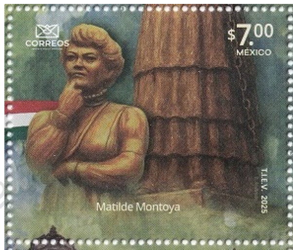
Fig. 3 Matilde Montoya

En su tesis profesional Montoya abordó el tema de la bacteriología, un campo poco conocido en ese entonces y hace hincapié en la microbiología para conocer las causas de las enfermedades. Su vida profesional la enfocó en tratar mujeres y niños; a lo largo de su trayectoria profesional siempre mantuvo un consultorio médico gratuito; formó parte de múltiples asociaciones feministas. Ejerció su profesión hasta los 75 años en que se retira por problemas de salud. Matilde falleció en la ciudad de México el 26 de enero de 1938 , casi a los 81 años de edad, una vida plena.