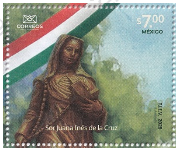
Fig.2 Sor Juana Inés de la Cruz