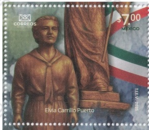
Fig.4 Elvia Carrillo Puerto

Su labor y el de otras mujeres, en pro del derecho al voto de la mujer dio frutos cuando en 1947 , durante el gobierno del presidente Miguel Alemán, se aprobó el voto de las mujeres en elecciones municipales y posteriormente, en 1953 , durante la presidencia de Adolfo Ruiz Cortines se aprobó el voto de la mujer en todas las elecciones a nivel nacional .