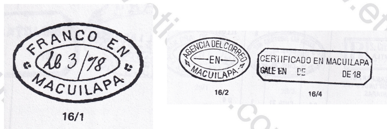
Fig. 6 Cancelaciones de Macuilapa, su número aparece al calce de cada imagen

En la obra sobre Cancelaciones postales (1874-1900) de Karl H. Schimmer , se muestran 3 cancelaciones (Fig. 6), de las que la primera a la izquierda (16/1) es la reportada por Schatzkes para cancelar estampillas de 1872; Schimmer indica que Macuilapa recibió estampillas de la serie de Comercio Exterior 1879 y Serie de Numerales 1886 .