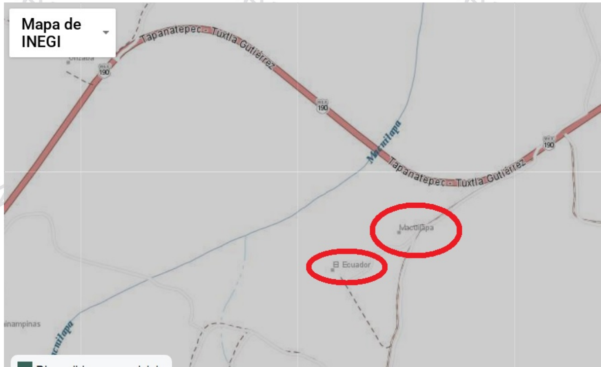
Fig. 8 Mapa del INEGI, época actual, resaltados con círculos rojos se aprecia Macuilapa y la comunidad El Ecuador, que se ha desarrollado muy cerca a la hacienda.

Actualmente la hacienda es propiedad privada y colinda con una comunidad que se llama El Ecuador (Fig. 8).